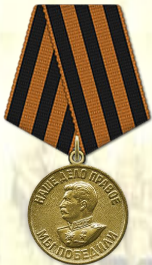
Медаль «За победу над Германией в Великой Отечественной войне 1941–1945 гг.»